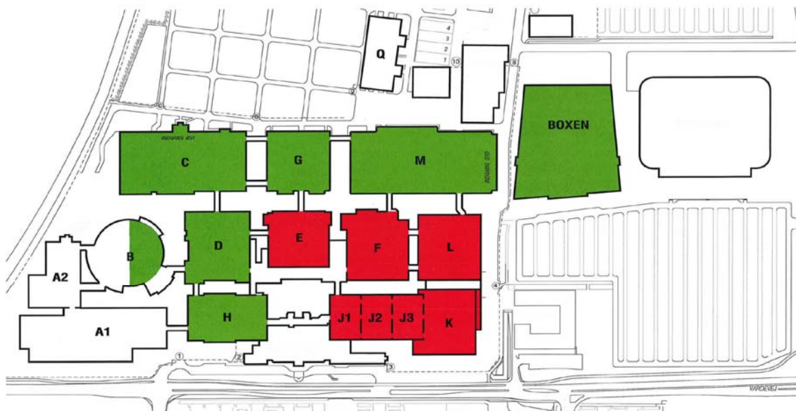
Figur 3 - Agromek samlet.

Figur 3 viser det fysiske omfang af en samlet Agromek udstilling, hvor den interne sektor er markeret med rød farve..