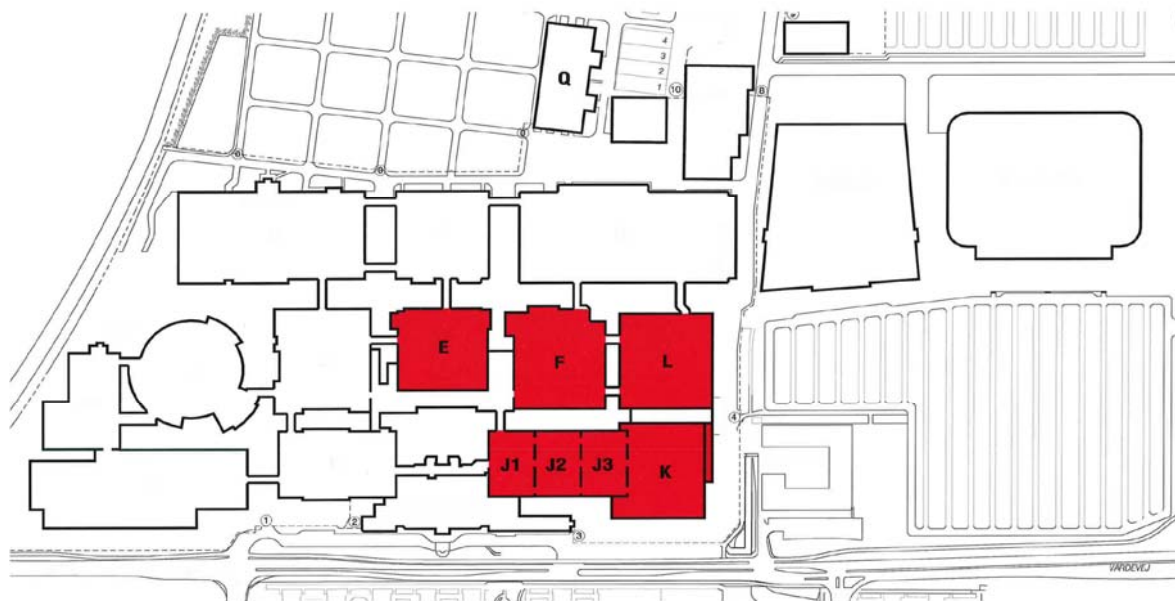
Figur 1 - Agromek Husdyr

Figur 2 viser det fysiske omfang, som en Agromek Mark må forventes at få. Det siger sig selv, at denne udstilling vil kunne have en bedre økonomi, men også denne udstilling indebærer betragtelige prisstigninger.